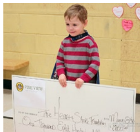
Riley et le gros chèque