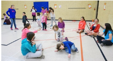
Des élèves de la maternelle ainsi que les 7 e -8 e années qui ont organisé les activités